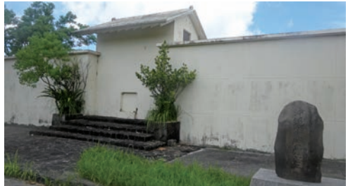
写真4 沖縄市納骨堂

同市営霊園には入り口近くに「納骨堂」がある。納骨堂は1990年(平成2)12月に建てられている。しかし無縁遺骨が増し、その後納骨堂の空間を増築拡張している。(写真4 沖縄市納骨堂)