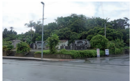
写真7 道路沿いの個人墓地

それでは、住宅地域の墓地への接近など、具体的に個人墓地はどこに造られていったかを探ると、市域を回れば商業地や住宅開発地も多く、住宅地にも近接し、自動車道路沿いに多くの個人墓地が見られる。(写真7 道路沿いの個人墓地)