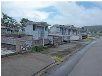
写真1 名座喜原墓園

名座喜原墓園は1963年（昭和38）に都市計画決定され、現在では公共事業による墓地の移転先（代替地）として運営しているが、今後の墓地需要によっては、区画数の拡大を検討する必要があるとする。一方1号宇茂佐墓園は1983年（昭和58）に都市計画決定されている。ここは公共事業の代替地ではなく、私人間で土地（墓地区画）の取引が行われている。