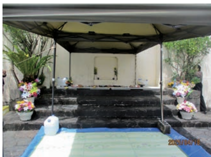
写真5 納骨堂前の清明祭

市民が「シーミー」と言っている清明祭は中国の清明節に由来する先祖供養の行事で、家族や親戚が集まり墓掃除やお供えなどをする。