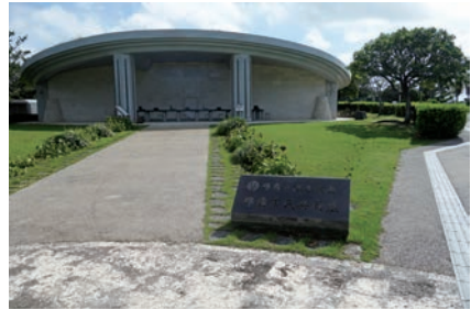
写真8 那覇市民共同墓全景

この那覇市民共同墓は2014年(平成26)に開設され、1階に合葬式墓地として「合葬用納骨室」2612壇と、奥に合葬室(2万体系埋蔵可能)と2か所の参拝室がある。納骨壇の前には行けず、2か所の参拝室から拝むか、屋外参拝所がある。納骨する時など参拝室(1時間500円)が使える。屋外参拝所には献花や焼香台があり、人々が訪れている。地下には短期収蔵納骨室が1812壇あり、5年間預けられ、1回だけ更新できる。(写真8 那覇市民共同墓全景)(図2 市民共同墓平面図)