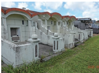
写真2 沖縄市営霊園全景

平坦な土地で区画の大きさは3種類あり、6坪（19.8m 2 ）は第1工区～第41工区、4.5坪（14.85m 2 ）は第42工区～第48工区、2坪（6.6m 2 ）は第49工区～第53工区ある。ほとんどが「家型墓」で、「平地式破風墓」と呼ばれる、最近造