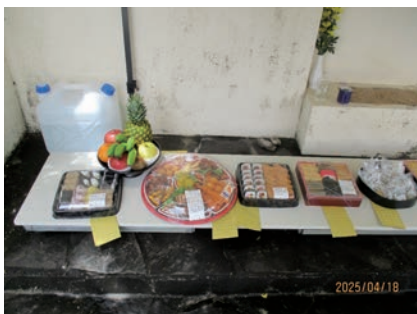
写真6 納骨堂前清明祭のお供え