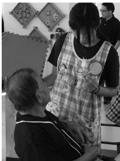
図2 ペンダント制作を通じた交流の場面

制作においては、幼児及び高齢者に「誰のために、どんな願いを込めてつくるか」を考えながら行うことを教示し、その内容については交流を通じて確認を行った。学生たちの提案により、つくる相手が見つからない場合は、学生たちとお互いに交換することにより、コミュニケーションを図るといった配慮もみられた(図2)。はじめのうちは、数名の高齢者が造形活動は難しいという理由をつけて拒否をしている姿がみられたが、制作工程が単純であったため、次第に笑顔で楽しむ姿がみられた。