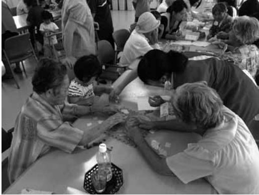
図3 高齢者や子どもへの声かけに配慮する学生

面などを配慮し、制作開始直前に水彩絵の具を使って下絵に色をつけることとした。実際に制作が始まると、自然物などを貼り合わせる時に同じ色を合わせることで、制作がスムーズに行われているようであった。